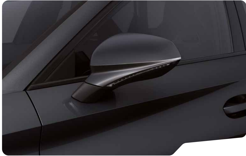
↓ MAGNETIC TECH