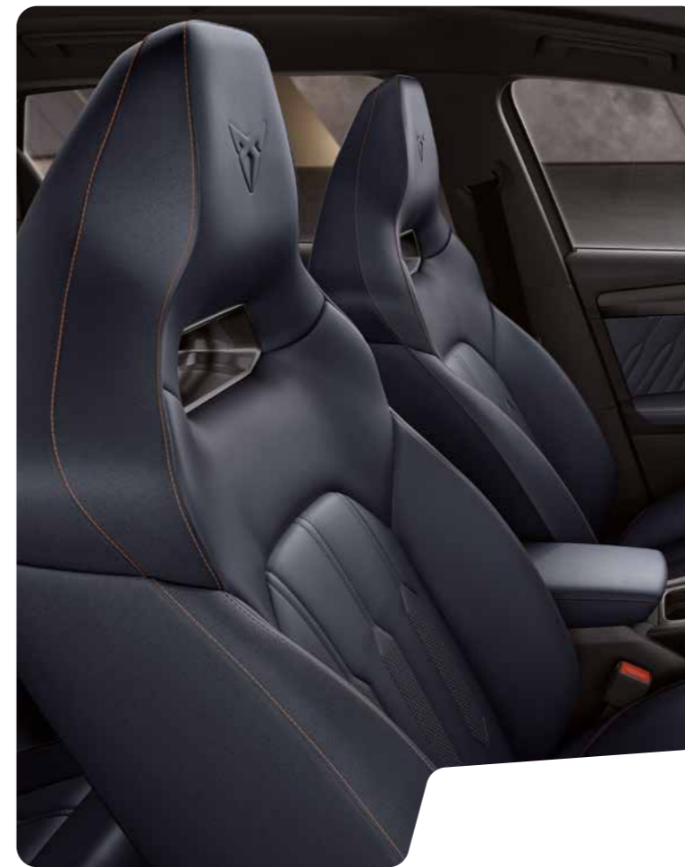
← PETROL BLUE LEDER