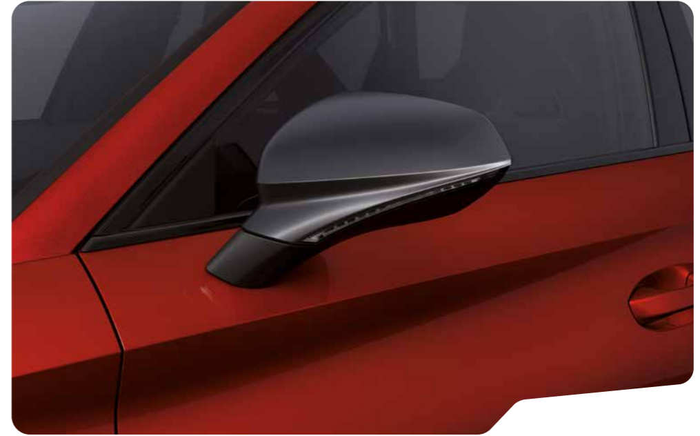
↓ DESIRE RED