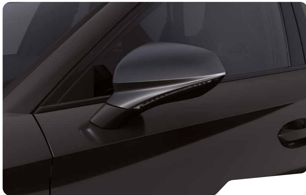
↓ MIDNIGHT BLACK