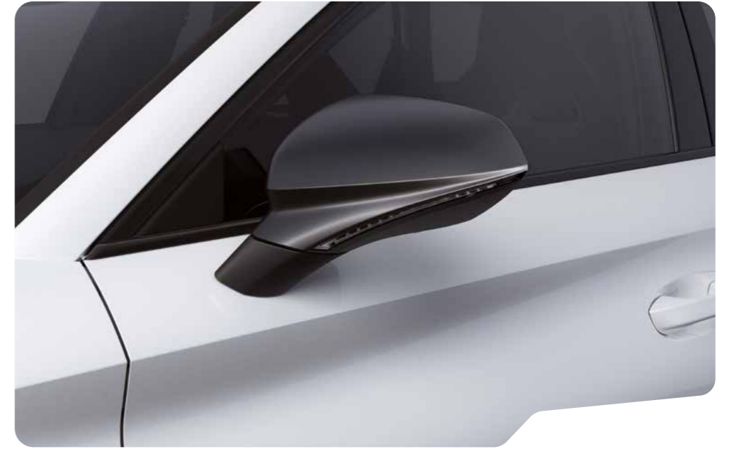
↓ NEVADA WHITE